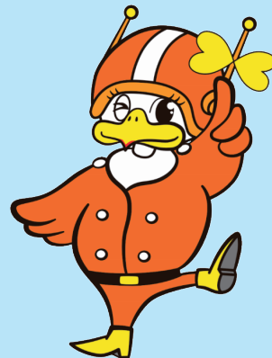
長野県警察 シンボルマスコット 「ライピちゃん」