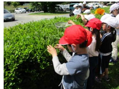
1年生は、はじめてのお茶摘み

参加していただいた地域の皆様、ボランティアの皆様、急な時間変更の中お集まりいただき、ありがとうございました。お茶の加工ができましたら全校で『新茶を味わう会』を開く予定です（6～7月頃）。おいしい緑茶を全校で楽しみたいと思いますので、その際はぜひまた足をお運びください。