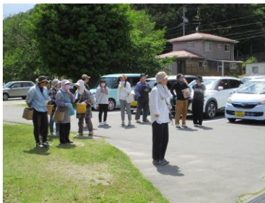
集まっていたいた皆様

茶摘みの準備や片付け、はじめの会の進行や説明は園芸委員会の皆さんが中心となって行いました。暑い時間帯でしたが、全校で協力して27kgの茶葉を摘むことができました。