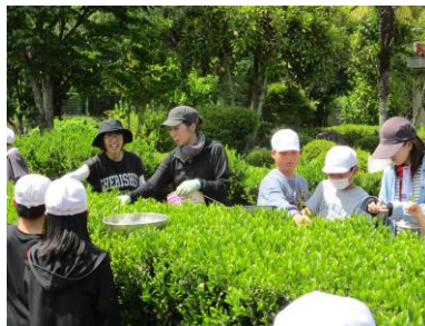
地域の皆さんと一緒に