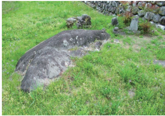
中川村の歴史・文化・自然 64 片桐中央地区の駒石

前途洋々だった若手パティシエの陶子は、カリスマシェフに叱責されたのと時を同じくして、お菓子作りができなくなる。そんな陶子に知人の小瀬が「思い出のオムレツ」について聞き取る取材に付き合わないかと声をかけてきて…。