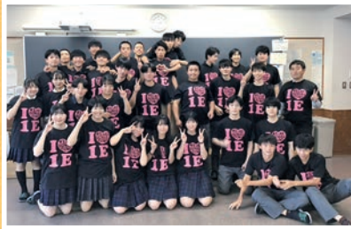
クラスメイトと(前列左から2番目)