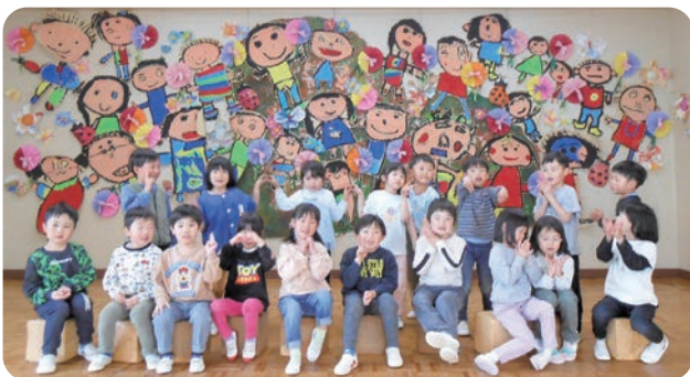
すみれ組(年長) 女の子8人 男の子11人 計19人