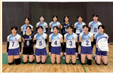
新人戦にて(前列右から3番目)