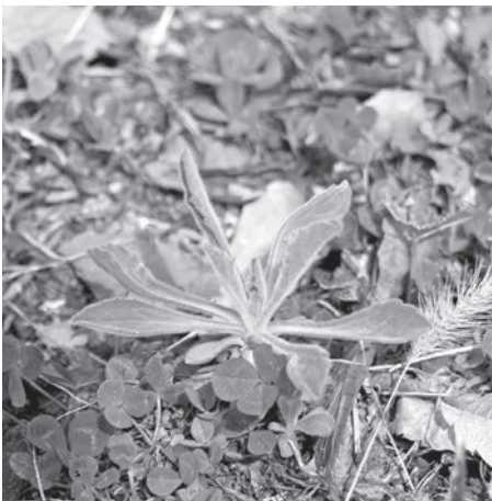
ツツザキヤマジノギク

陣馬形山で開山式が行われた後、陣馬形の森公園内にあるツツザキヤマジノギク（イナノギク）の保護エリアにネットを張る作業を行いました。ネットで囲まれたエリアには、ツツザキヤマジノギクのロゼット（臺が立つ前の根生葉が生えています。ネット内には立ち入らないようにお願いします。少しでも景観の邪魔にならないように、今年からネットは黒くなりました。今後草取りや苗の補植などの世話をしていく予定ですが、秋ごろ（昨年は10月中旬）にはきれいな花を咲かせてくれると思います。その頃には保全協議会によるイベントも企画されています。 ツツザキヤマジノギクは県の絶滅危惧種に指定され、中川村と松川町など伊那谷の一部でのみ生育が確認されています。村内では陣馬形山のほか、学校周辺などに植栽地があります。村の美しい環境を守るお手伝いも、私のミッションの一部です。