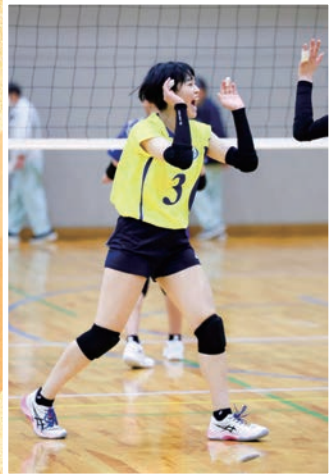
全国私立高等学校 男女バレーボール選手権大会にて