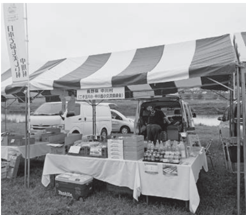
物産展中川村ブースの様子 交流センター TEL96-0658