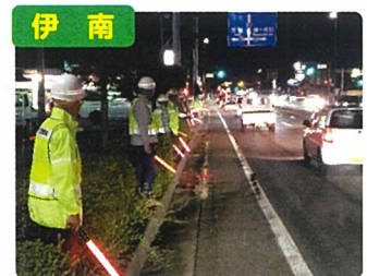
交通安全運動・ピカピカ作戦