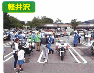
安中・軽井沢合同街頭指導