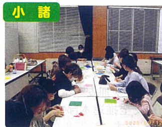
交通安全活動配付物品作成