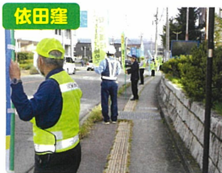
交通安全運動・人波作戦