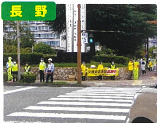
交通安全運動・啓発活動

交通安全協会は、交通事故をなくすため、様々な活動を行っています。活動の一例を紹介します。