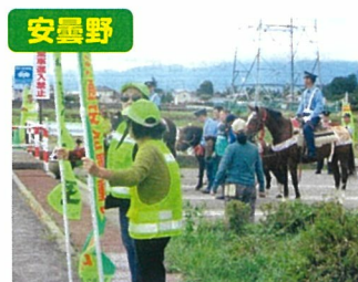
交通安全運動・啓発活動