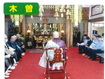
交通事故物故者法要