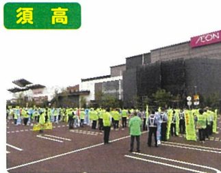
交通安全運動・人波作戦