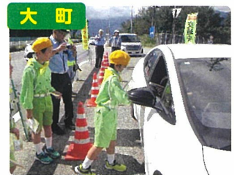
交通少年団レター作戦