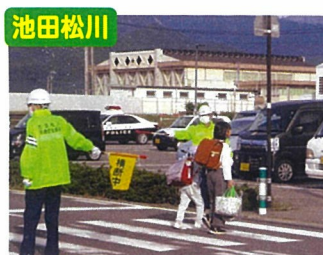
通学児童見守り活動