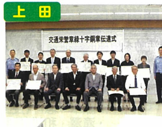
緑十字銅章伝達式