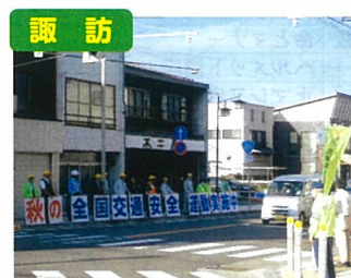
交通安全運動・人波作戦