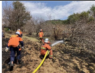
消火活動の様子 (R6.4.2 美里地区その他火災)