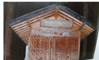
▲ 十四番札所 観音堂