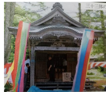
▲ 十二番札所 三十三所堂(跡)