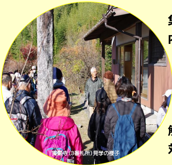
実徳寺(3番札所)見学の様子