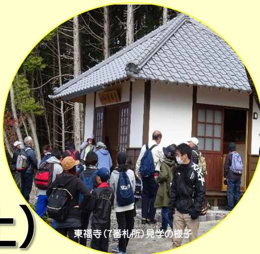
東福寺(7番札所)見学の様子