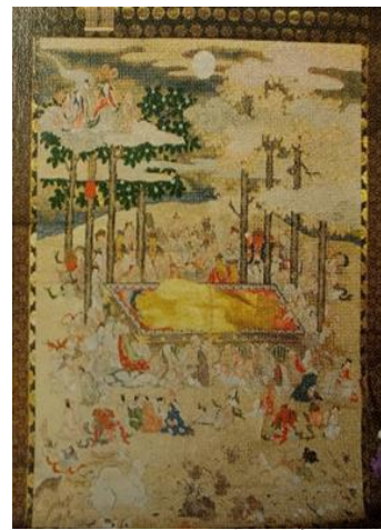
▲ 十三番札所 珠寶山 塩泉院 釈迦涅槃図