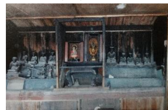
▲ 十六番札所 福聚庵 地藏菩薩像・十王像・薬師如来像