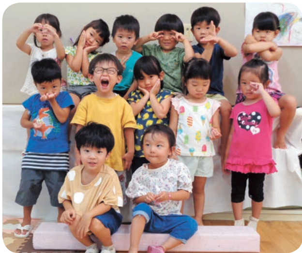
ゆり1組(年少) 男子6人 女子7人 計13人