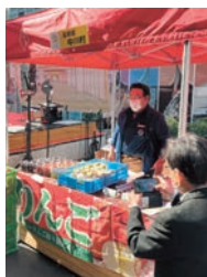
マルシェ (昨年の様子)