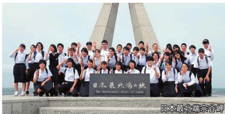
日本最北端宗谷岬

二日目は中川町の中学生と交流会をしました。交流会では最初に僕たちの住む中川村の紹介をして、発表が終わったあと、中川町の人たちと班を組んでスポーツ交流をしました。交流ではモルツクとボツチャというスポーツをして楽しみました。スポーツと休憩時間を通して中川町の生徒と仲を深めることができました。中川町の人たちは優しく、色々話しかけてくれて嬉しかったです。スポーツ交流が終わったあと、中川町の人たちと稚内見学をしました。稚内見学では宗谷岬、北方記念・開基百年記念塔、寒流水族館などを一緒に見学しました。宗谷岬では日本最北端の地として中川町の人たちと一緒に写真撮影をしました。バスに戻るとき、す