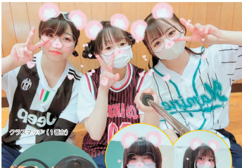
クラスマッチ (1番左)