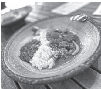
写真：中川村産トマトとしめじの『チキンカレーとキーマカレー(あいがけ)』

来てくださったお客さんにも大変好評で、自分としても中川村の魅力をうまく伝えることができたのではないかと思います。