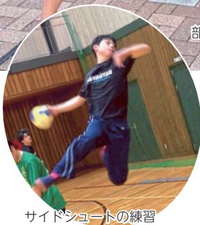
サイドシュートの練習