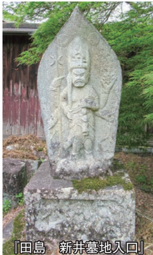
『田島 新井墓地入口』

今日まで剣に生きてきて、兵法というほどのものではない。ただのチャンバラにすぎんー。初陣から佐々木小次郎との激闘、<最後の戦い>まで、剣聖・宮本武蔵と数々の強敵との名勝負を描く。