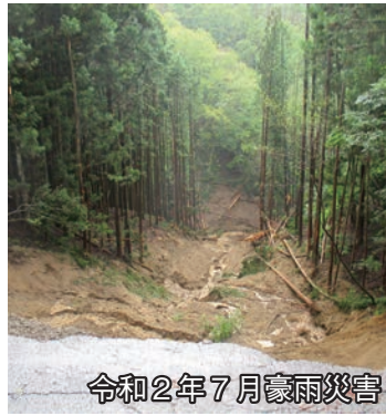
令和2年7月豪雨災害