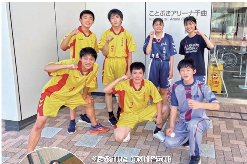
部活の仲間と(前列1番左側)