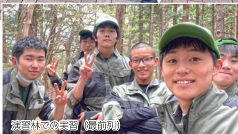
演習林での実習(最前列)