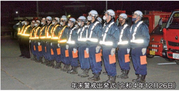
年末警戒出発式(令和4年12月26日)

全国的に頻発しており、中川村にもいつ大きな災害がやってくるかわかりません。災害が発生した時、地域を守るために先頭に立って活躍するのが消防団員です。自分たちの地域を自分たちで守るため、ぜひ若いみなさんの力を貸してください。