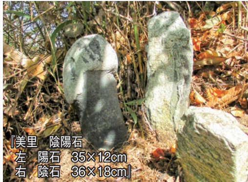
【美里 陰陽石 35×12cm 左右 陽石 陰石 36×18cm】

以前、美里地区で双体道祖神の所在地を探していたとき、美里在住の西村晃さんに『中川村の石造文化財』に載っていない陰陽石を案内していただいた。古い道に続く辻から見上げる斜面の笹竹の中にあり、普通に通っただけではわからない場所にあった。この陰陽石は、小和田の福守様（図書館だより114号参照）と違い、加工したように見えず、それらしい