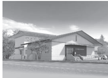
新資料館イメージ図

この機会にぜひ資料館へお越しください。なお、長期休館中も学芸員は勤務していますので、ご家庭で見つかった古文書や民俗資料、兵事資料など取り扱いに困るものがありましたら、歴史民俗資料館または教育委員会へご連絡ください。