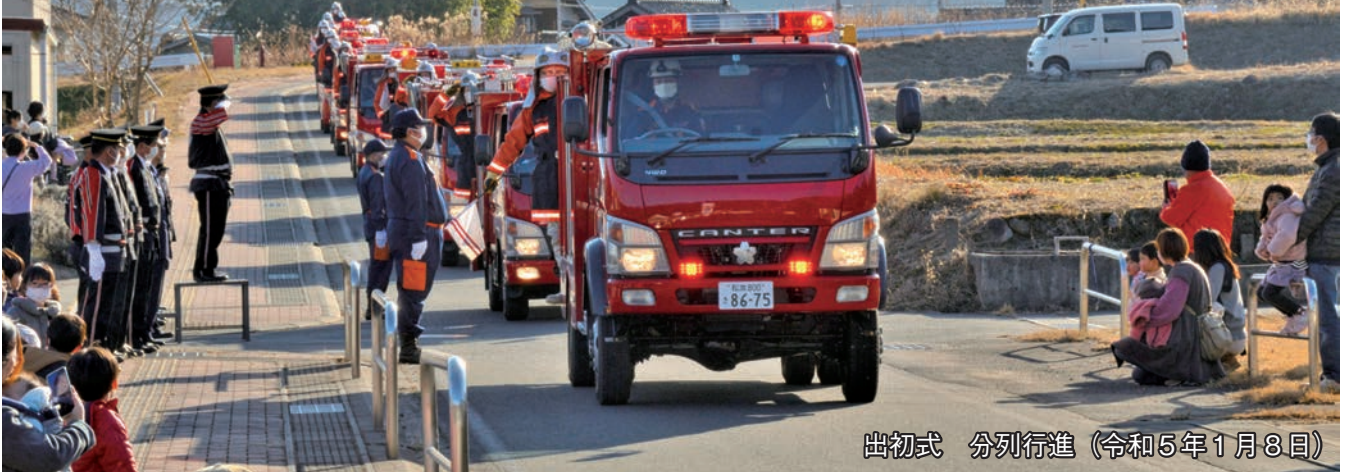
出初式 分列行進 (令和5年1月8日)

団員のご家族のみなさん、また職場や地域住民のみなさんにおかれましては、日頃から消防団活動にご理解ご協力いただいておりますことに深く感謝し、厚くお礼申し上げます。