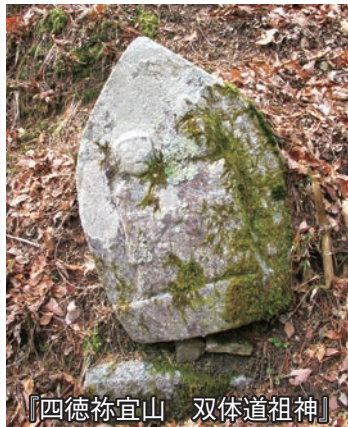
【四徳祢宜山 双体道祖神】

なかでも双体道祖神は、双体であるからこそ、縁結び・夫婦和合・子宝授け・子孫繁栄・五穀豊穡といった陰陽石の信仰を特に色濃く受け継いでいるのではないだろうか。コロナ禍や少子高齢化の今にも通じる人々の願いである。