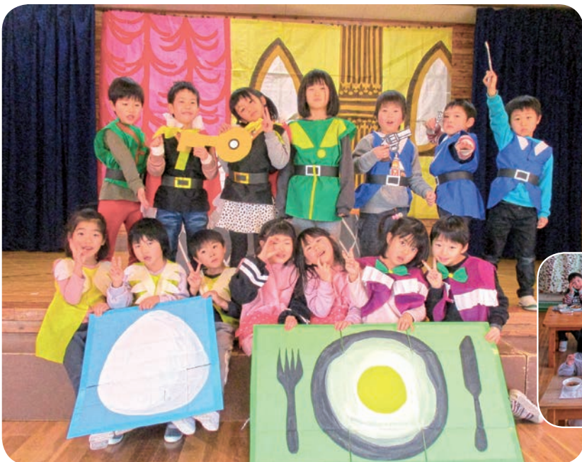
お楽しみ会で「おしゃべりなたまごやき」の劇をしたよ。

きりん組 (年長) 男子7人 女子7人 計14人 4月からは小学生! 保育園でいっぱい遊んで、 いろいろなことにチャレンジして 楽しもうね!!