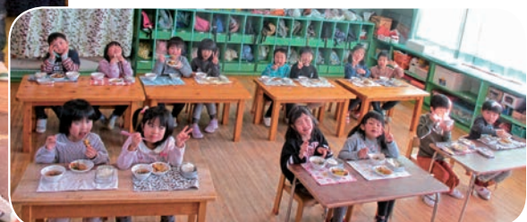
小学校みたいに並んでご飯を食べたよ。

きりん組 (年長) 男子7人 女子7人 計14人 4月からは小学生! 保育園でいっぱい遊んで、 いろいろなことにチャレンジして 楽しもうね!!