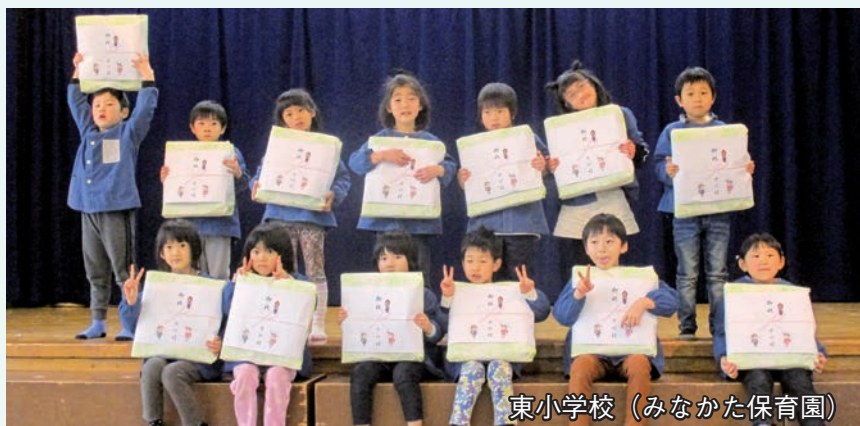
東小学校（みなかた保育園）

園児は名前を呼ばれると元気よく返事をして大きなかばんを受け取り、春からの登校が待ちきれない様子でした。令和5年度中川村の小学校では、38人の新入学を予定しています。