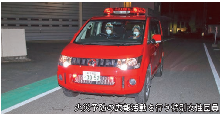
火災予防の広報活動を行う特別女性団員

上伊那地域ではすべての市町村で女性消防団員が活躍しており、村としても一般団員または機能別団員として活動していただけの方を募集しています。