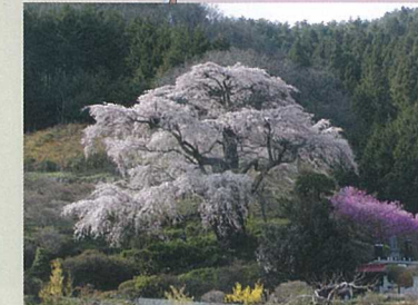
1 西丸尾のしだれ桜