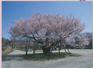
11 中川西小学校の百年桜