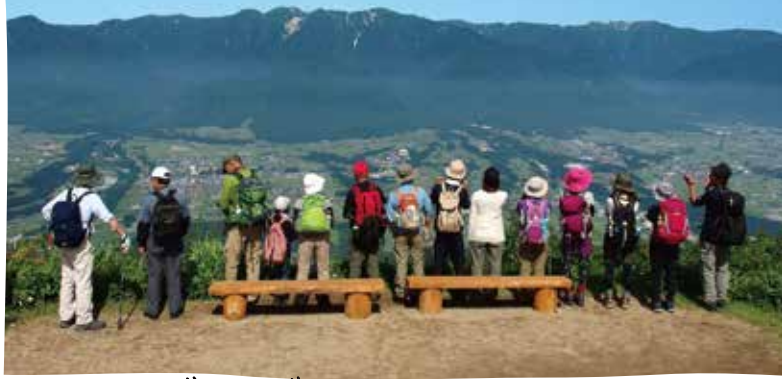
ジンバガタヤマオリ