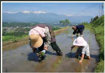
おいしい野菜、お米が食べられる