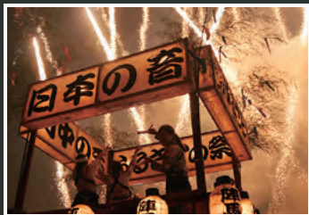
大迫力のどんちゃん祭り