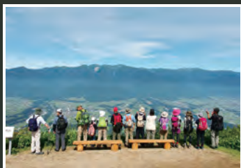
陣馬形山からの景色は絶景!