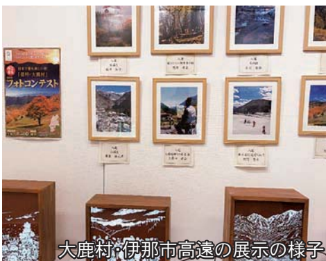
大鹿村・伊那市高遠の展示の様子

同ホールは県内外から多くの観光客が訪れる施設です。日本各地に広がる美しい村の紹介に加え、中川村の観光パンフレットの配布なども行い、連合及び村のPRを行うことができました。